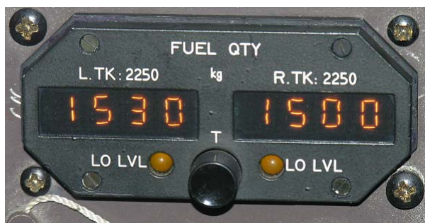
Fuel Quantity Indicator ATR-42

Ciò nonostante, i FQI tipo ATR-42 e ATR-72 sono identici sia dal punto di vista dimensionale che di installazione; pertanto, un FQI tipo ATR-42 può essere erroneamente installato su un velivolo ATR-72 e viceversa. L’unica differenza visibile tra i due FQI è rappresentata da una scritta di colore bianco di piccole dimensioni indicante la quantità di carburante massima per serbatoio alare, riportata sul frontalino dello strumento, pari a “2500” per il FQI tipo ATR-72 e “2250” per il tipo ATR-42.