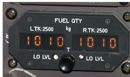
Fuel Quantity Indicator ATR-72

Al fine di verificare gli effetti di un’erronea installazione in termini di quantità carburante indicata in cabina di pilotaggio, sono state condotte numerose prove di rifornimento.